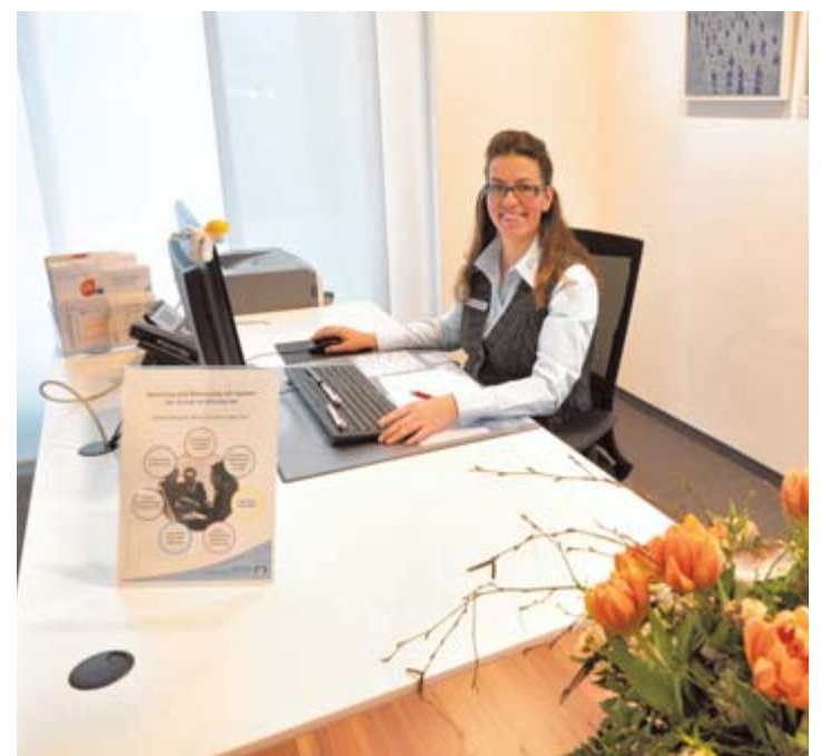
Bei den Beratungszimmern wurde mit Glasflächen auch auf Transparenz und Offenheit geachtet, dennoch wird heute noch mehr Diskretion geboten.