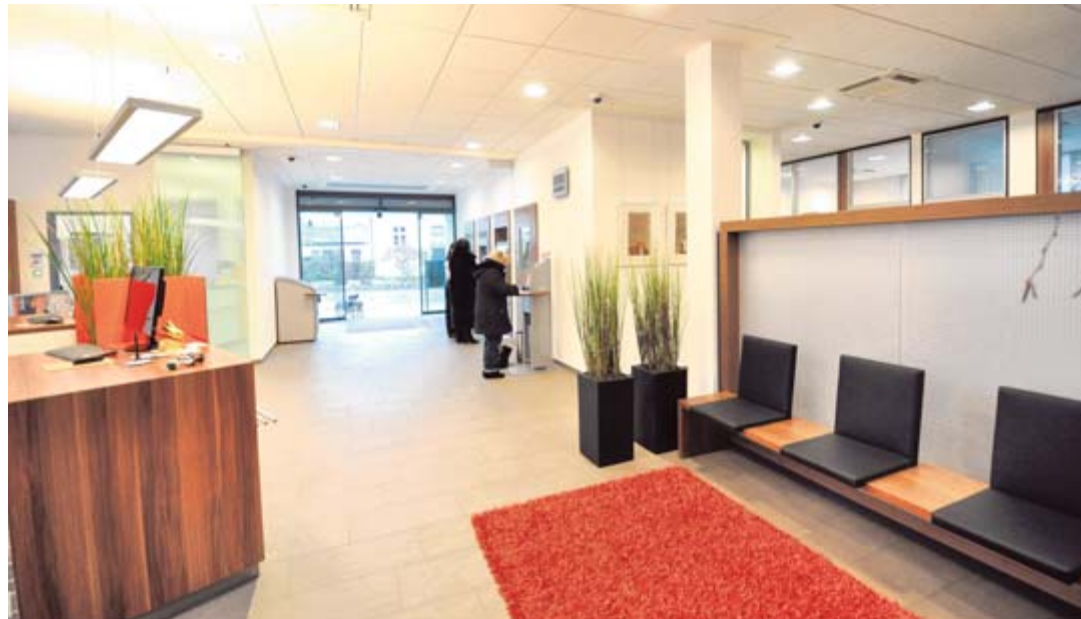
Der Kundenbereich wurde hell, freundlich und zeitgemäß gestaltet, die Filiale wirkt offener und größer. Die Kunden werden nun in einem ansprechenden Servicebereich mit einzelnen Beratungspunkten betreut.

Für die Mitarbeiter der Bank wurde ein geräumiger Aufenthaltsbereich mit neuen, modernen Sanitär-Anlagen geschaffen. Der Bankbereich im Erdgeschoss wurde grund-