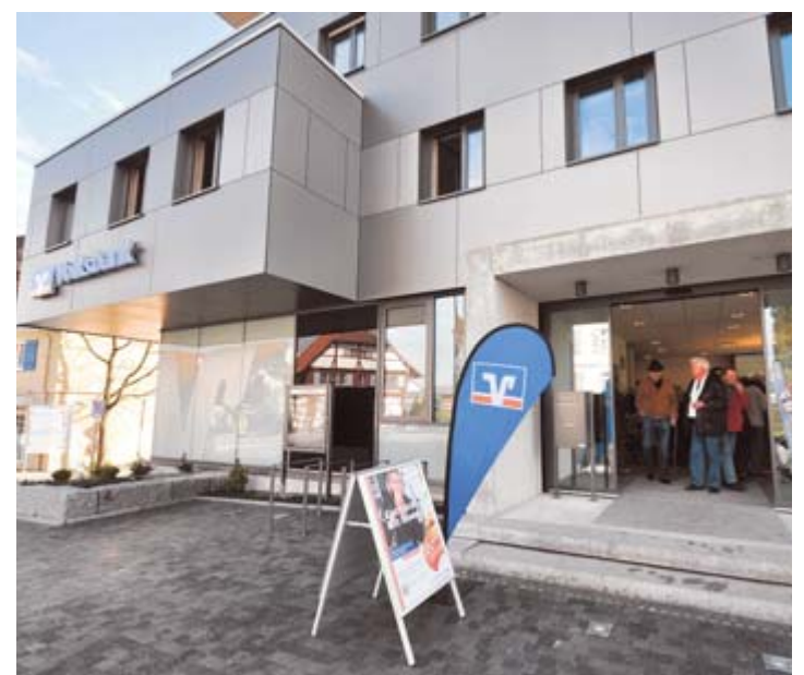
Der Eingangsbereich ist barrierefrei. Sitzblöcke an der Ecke Wattgraben und Meersburger Straße laden zum Verweilen ein.

Und das alles wurde von 37 fleißigen und kompetenten Handwerksbetrieben realisiert, die alle aus der Region rund um Immenstaad sind.