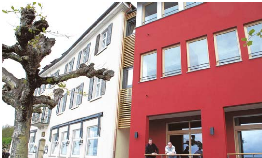
Der rote Neubau des „Hotel zum Schiff“ in Meersburg, der maritimen Charakter versprüht, ist pünktlich zu Pfingsten fertig geworden. BILDER: GANZERT

Als die Gäste im Herbst 2009 abreisten, kamen die Handwerker und zogen in nur sieben Monaten den Neubau mit der roten Fassade hoch, der maritimen Charme versprüht. Durch eine Glasfuge sind Alt- und Neubau miteinander verbunden und so erscheint die Gebäudenah fließend wie Wasser.