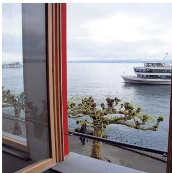
Direkt an der Promenade genießen die Hotelgäste einen einmaligen Blick auf den Bodensee.

Das Hotel ist mit 55 Zimmern und 120 Betten das größte Hotel in Meersburg. Im Restaurant gibt es 110 Plätze, im neuen Teil einen 150 Quadratmeter großen und mehrfach teilbaren Tagungsraum sowie ein Tagescafé mit Terrasse. Telefon: 0 75 32/45 00-0 Telefax: 0 75 32/15 37 info@hotelzumschiff.de www.hotelzumschiff.de